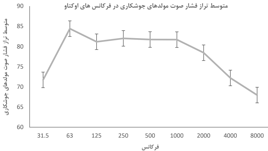
شکل (۲) - متوسط تراز فشار صوت مولد های جوش کاری در فرکانس های اوکت

که در شرایط خاموش بودن مولد های دیزلی اندازه گیری شده بود، از حدود مجاز سازمان محیط زیست (۵۵ دسی بل در طی ساعات ۸ صبح الی ۱۰ شب) تجاوز کرده بود و این تجاوز از حدود مجاز به دلیل صدای ناشی از ترافیک و تردد خودروها در اطراف سایت های ساخت و ساز بود. (جدول ۱) لذا با توجه به صدای زمینه موجود، حتی در شرایطی که مولدهای دیزلی خاموش هستند صدا از حدود مجاز سازمان محیط زیست تجاوز خواهد کرد و در صورت استفاده از استاندارد موجود سازمان محیط زیست ارزیابی صحیحی از صدای ناشی از مولد های دیزلی صورت نخواهد گرفت. در این مطالعه، حدود مجاز صدای محیط زیستی با اقتباس از استاندارد BS 5228 (صدای زمینه به اضافه ۵ دسی بل) بر اساس صدای زمینه موجود در هریک از سایت های ساخت و ساز به دست آمد، لذا هریک از سایت های ساخت و ساز حدود مجاز مختص به خود را خواهد داشت. متوسط تراز صدای زمینه در ۱۴ سایت ساخت و ساز بررسی شده در این مطالعه ۴۶/۲۰ دسی بل اندازه گیری