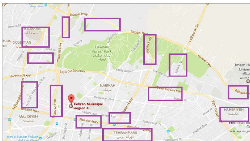
شکل (۱) - سایت های ساخت و ساز بررسی شده در نقشه منطقه ۴ شهرداری تهران

در این مطالعه توصیفی (نوع هم خوانی)، صدای ناشی از مولدهای دیزلی برق جوش کاری در واحدهای ساختمان سازی واقع شده در محدوده منطقه ۴ شهرداری تهران مورد ارزیابی قرار گرفت. تعداد ۱۴ سایت ساخت و ساز (شکل ۱)، با توجه